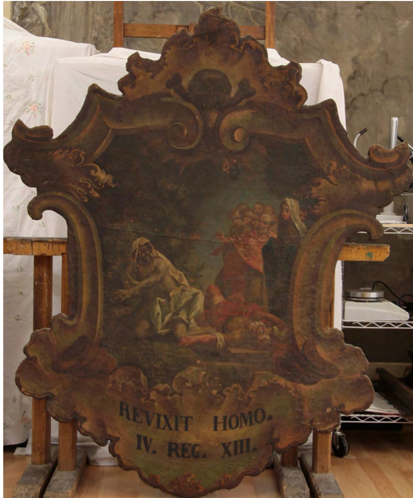
prima del restauro