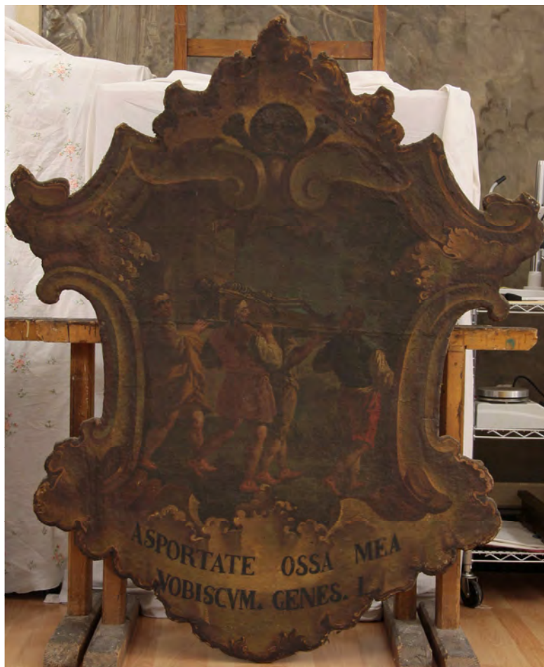
prima del restauro