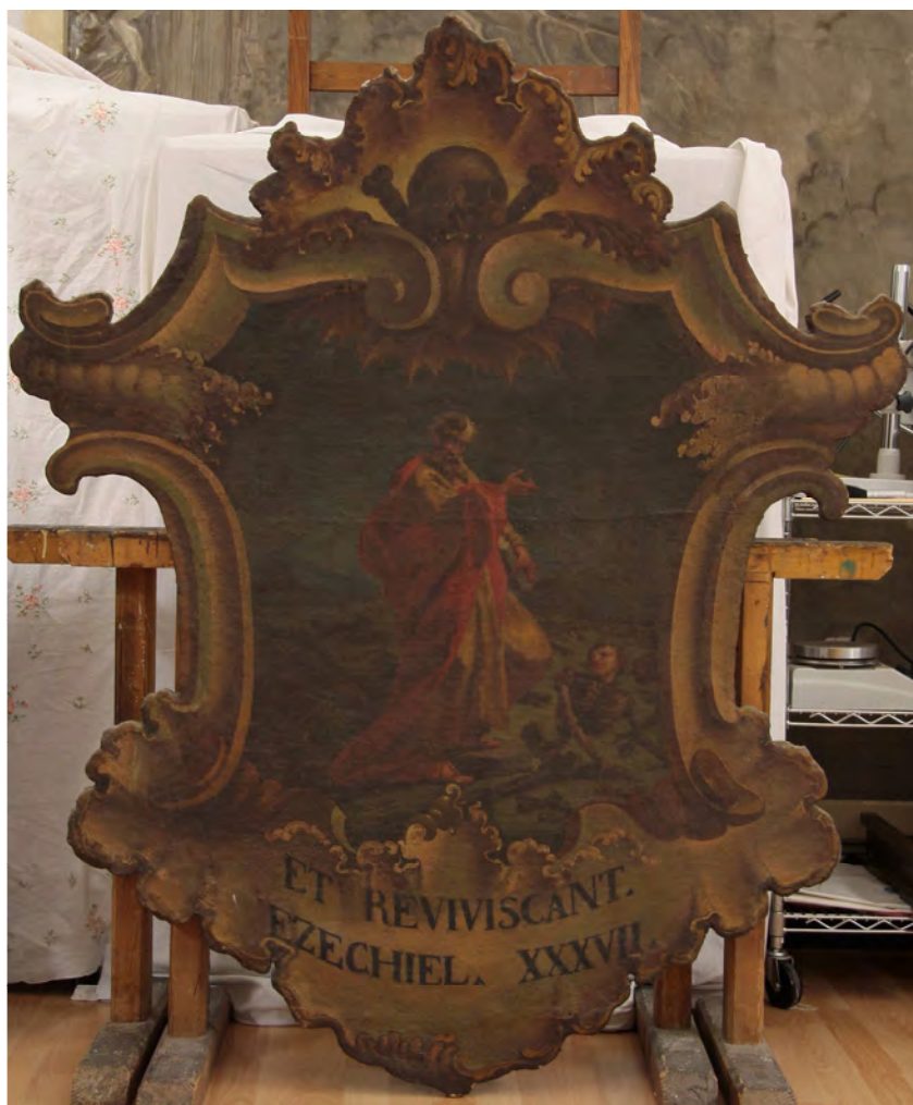
prima del restauro