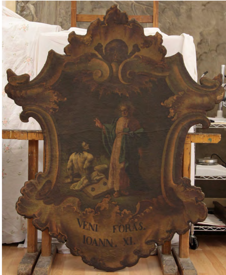
prima del restauro