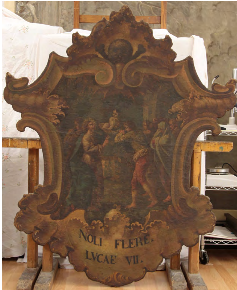
prima del restauro